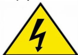
Coupsures de courant pour travaux

Pour que ces travaux puissent être réalisés en toute sécurité, nous vous rappelons que si vous deviez utiliser un moyen de réalimentation (groupe électrogène, alternateur sur tracteur), il est obligatoire d'ouvrir votre disjoncteur général ENEDIS (le positionner sur 0).